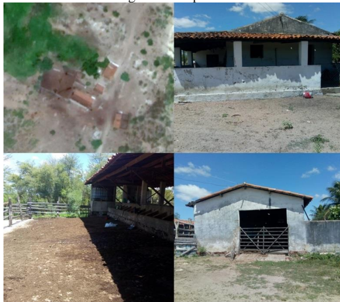
Figura 1. Propriedade Rural

O presente trabalho traz como material de estudo a aplicação dos conhecimentos a respeito de biodigestores em um sítio (Figura 1) de pequeno porte, localizado na zona rural do município de Angicos/RN. Tendo como coordenadas geográficas 5°40'6.18" de Latitude Sul e 36°34'53.02" de Latitude Oeste.