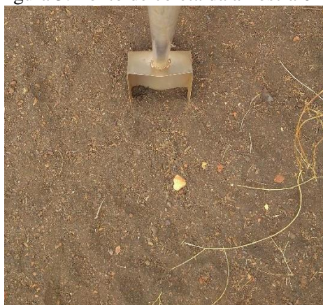
Figura 3: Ponto de coleta da amostra 02