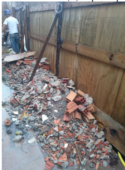
Figura 2. Resíduos Classe (A) dispostos para coleta.

Os resíduos de classificação (B) e (D) não podem ser dispostos nesse aterro segundo norma, então são recolhidos pela empresa terceirizada e levada ao centro de reciclagem. Após essa triagem inicial, são destinados conforme diretrizes de reciclagem e conservação ambiental (Figura 3).