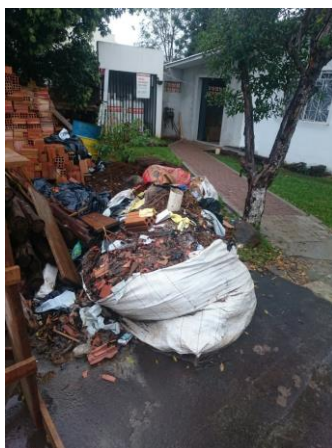
Figura 3. Resíduos da classe (B) e (D)

A quantidade de resíduos sólidos oriundos de demolição de paredes de alvenaria é um grande problema nesse tipo de obra, pois normalmente são os materiais mais pesados e de maior volume. Em grandes centros urbanos, com maior desenvolvimento e recursos, esses (RCC) passam por um processo de reciclagem, moendo-os e fazendo a granulometria adequada para cada caso. Sendo assim, os mesmos são destinados a áreas de uso na construção civil, porém ao mesmo tempo em que apresentam um grande potencial reutilizável, a falta de fiscalização e visão de conservação ambiental, faz com que, muitas vezes, seja despejado em locais inapropriados, aumentando a demanda de lixo urbano pela prefeitura.