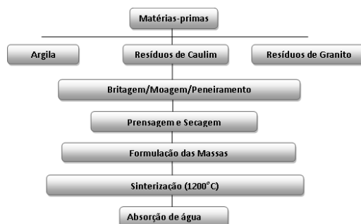
Figura 1. Distribuição espacial dos postos pluviométricos da área de estudo.

O fluxograma mostra detalhadamente o esquema de procedimento experimental para a fabricação do porcelanato através da utilização de resíduos de caulim e granito, além da argila.