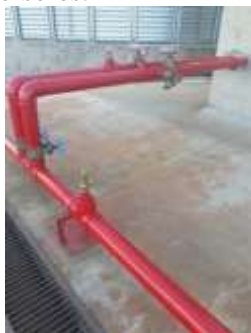
Figura 1: Cavalete hidráulico para acionamento dos bicos aspersores.