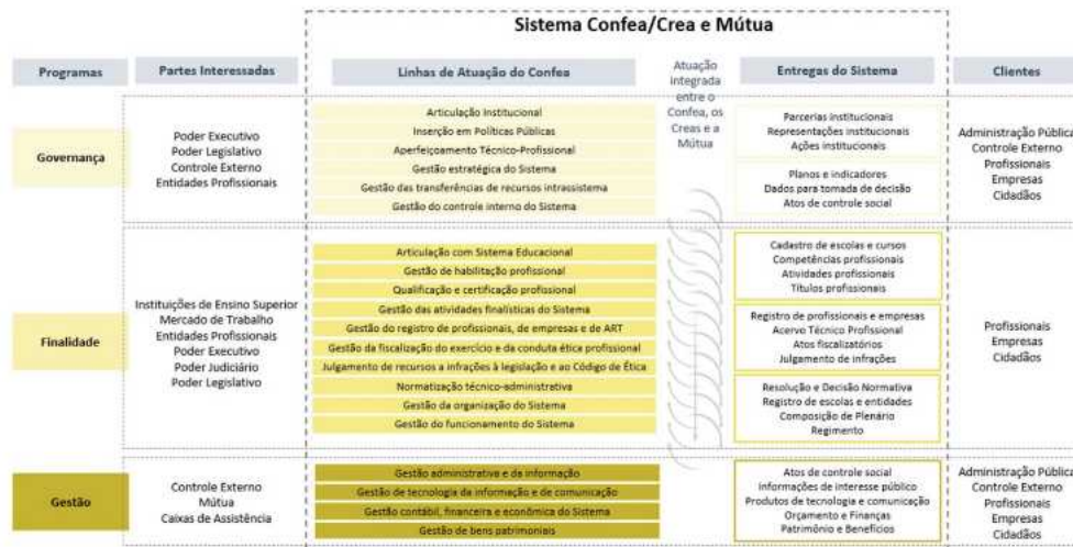
Figura 1. Modelo de Negócio Sistema Confea/Crea e Mútua 2023

Nesse contexto, o modelo de negócio do Confea consiste na forma como se cria, entrega e captura valor, de modo que a entrega do valor público do Confea deve se guiar pela atuação sistêmica, isto é, integrando os 27 Creas e a Mútua. A figura a seguir apresenta os programas que conduzem a atuação do Sistema, as partes interessadas (ou stakeholders ) e as linhas de atuação do Confea, os quais interdependem da atuação dos Creas para gerar as entregas do Sistema para cada tipo de cliente.