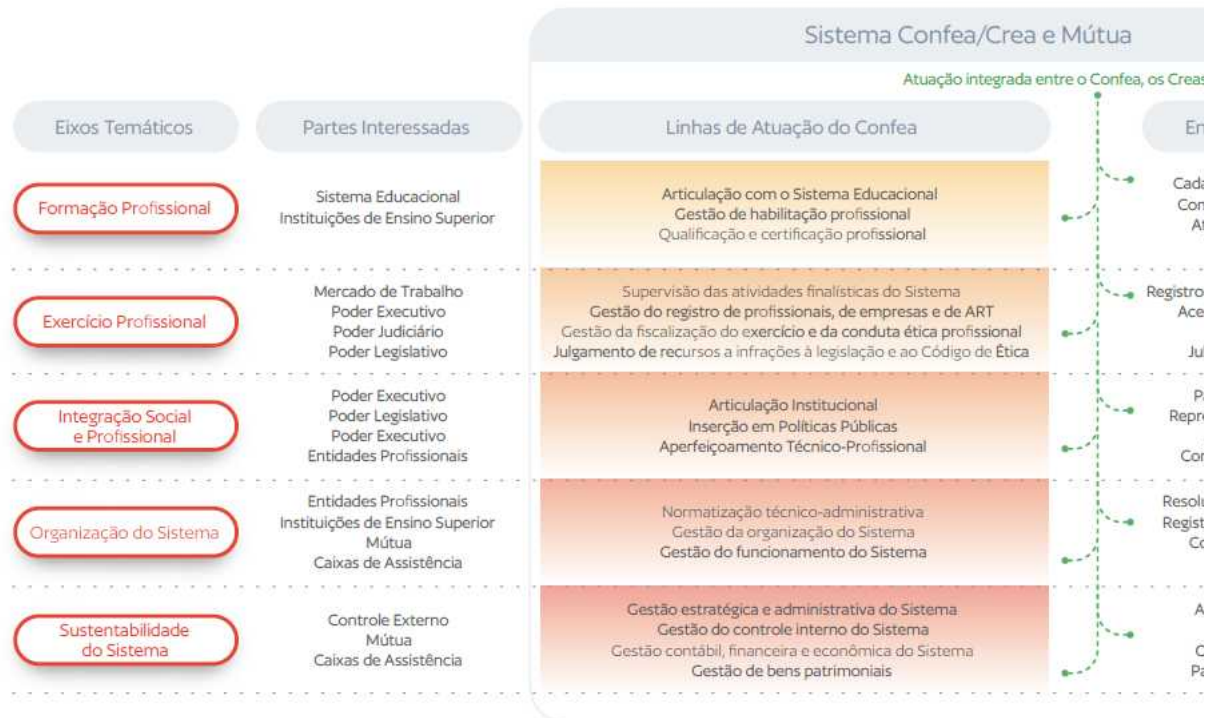
Figura 1 - Modelo de Negócio Sistema Confea/Crea e Mútua 2022

Nesse contexto, o modelo de negócio do Confea consiste na forma como se cria, entrega e captura valor, de modo que a entrega do valor público do Confea deve seguir pela atuação sistêmica, isto é, integrando os 27 Creas e a Mútua. A figura a seguir demonstra os eixos temáticos que guiam a atuação do Sistema, as partes interessadas (ou stakeholders) e os macroprocessos do Confea, os quais interdependem da atuação dos Creas para gerar as entregas do Sistema para cada tipo de cliente: